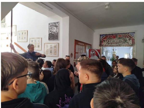
Gyergyóújfalu, Elekes Vencel Általános Iskola

A negyedik napon Gyergyóújfaluba látogattunk az Elekes Vencel Általános Iskolába. Nagyon kedvesen fogadtak bennünket az ottani igazgató és a diákok. Barátságos focimérkőzést játszottak a gyerekek, amelyet sikerült megnyernünk. A közös sportolás jó alkalom volt az ismerkedésre. Ezután Csicsajra mentünk, ahol finom teát és kürtőskalácsot készítettek nekünk. Egy érdekes előadást is meghallgathattunk a környék növény- és állatvilágáról. Sok új információt tudtunk meg az erdélyi erdők növény és állatvilágáról. Később túrázni indultunk a természetben, ahol a gyönyörű tájat közelebbről is megcsodálhattuk. A program végén szalonnát sütöttünk, ami nagyon jó hangulatban telt. Este még ellátogattunk a Libáni kőfejtőhöz is, amely különleges látványt nyújtott. Fáradtan, de sok élménnyel gazdagodva tértünk vissza a szállásra.