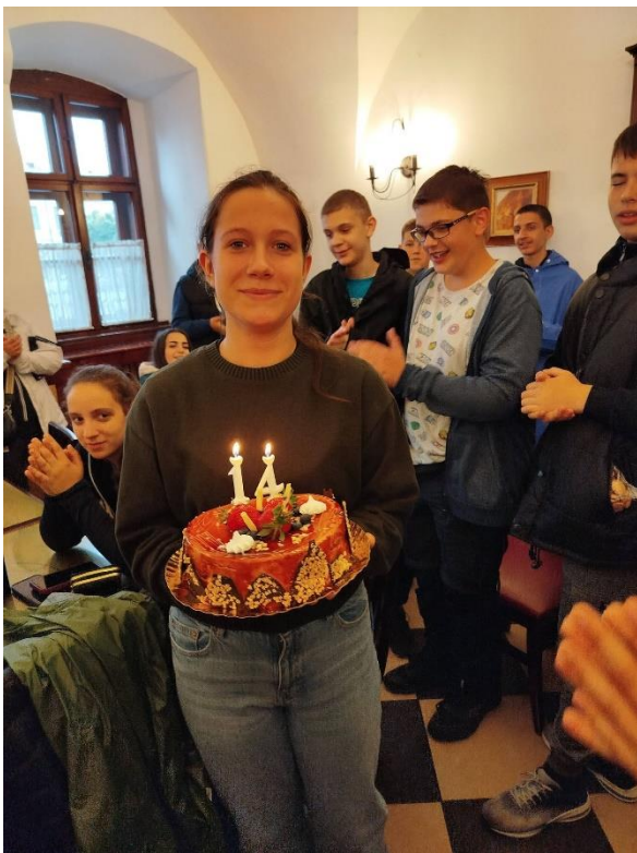
Székelyudvarhely, Alexandra cukrászda