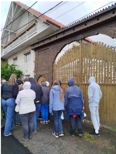
Korond, székelykapuk motívumvilágának jelentése