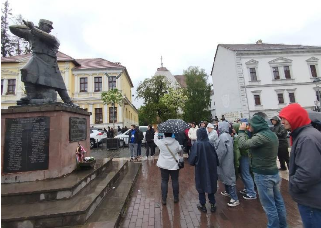
Székelyudvarhely, Vassékely szobra