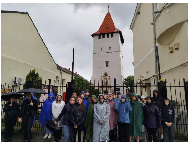
Nagyszalonta, Csonka torony