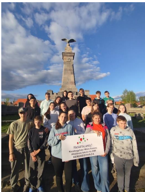
Madéfalvi veszedelem emlékműve