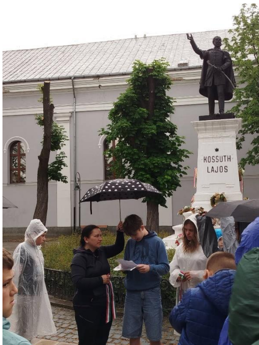
Nagyszalonta, Kossuth Lajos emlékműve