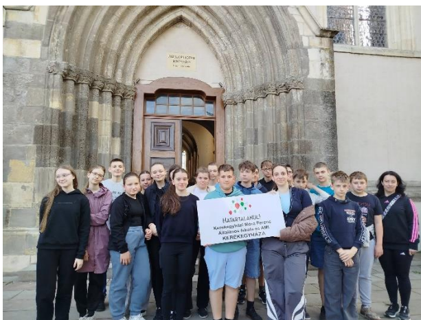
Marosvásárhely, Református vártemplom

Kirándulásunk utolsó napján Marosvásárhelyre indultunk először. Megnéztük a református vártemplomot és Hunyadi János szobrát. Ezután Kolozsvárra utaztunk, ahol megtekintettük Mátyás király híres lovas szobrát és szülőházát is. Érdekes volt látni azt a várost, ahol a híres magyar király született. Sok történelmi emlékekkel találkoztunk a városban. Hazafelé megálltunk a Királyhágónál, ahol gyönyörű panoráma tárult elénk. Innen búcsút vettünk Erdély hegyeitől és tájaitól. Utolsó állomásunk Nagyszalonta volt, ahol megnéztük Kossuth Lajos és Arany János szobrát. Felkerestük a Csonka-tornyt is, amely Arany János emlékét őrzi. A hosszú út során sok élménnyel és új ismerettel gazdagodtunk. A Határtalanul! kirándulás felejthetetlen élmény marad számunkra.