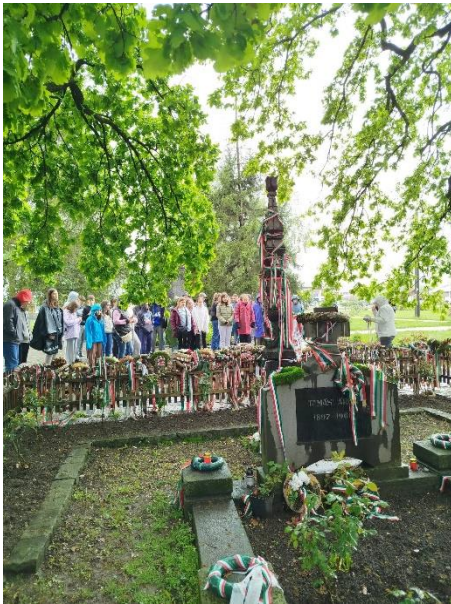
Farkaslaka, Tamási Áron emlékmű