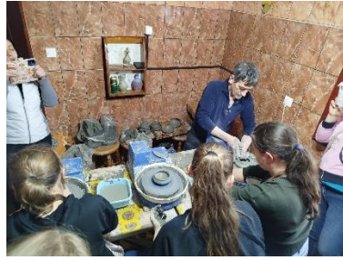
Korond, kerámia festés, korongozás