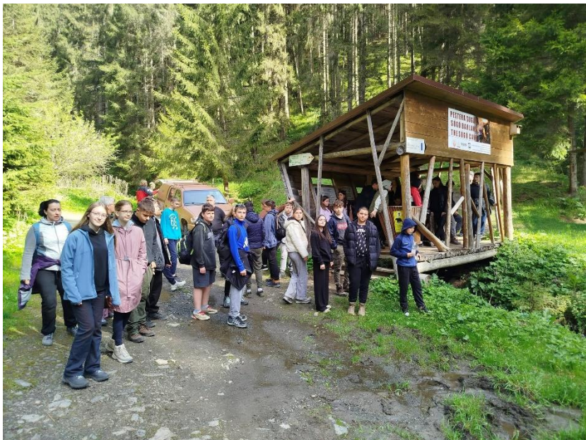
Túra a Sűgő-barlanghoz

Az ötödik napon idegenvezető segítségével elsőként a Sűgő-barlangot látogattuk meg. A barlangban cseppköveket és különleges sziklaformákat láttunk. Érdekes volt hallani a barlang kialakulásáról és élővilágáról. Ezután a híres Békás-szorozhoz utaztunk. Túrúztunk a hatalmas sziklák között, miközben gyönyörködtünk a vadregényes tájban. Sok helyen nagyon keskeny és meredek volt az út, ezért különösen figyelniünk kellett. A természet ereje és szépsége mindenkit lenyűgözött. Később a Gyilkos-tóhoz mentünk, amelynek legendáját is megismertük. A tó különleges látványt nyújtott a vízből kiálló fatörzsekkel. Sétáltunk a tó partján, majd ajándékokat és emléktárgyakat vásároltunk. Ez a nap különösen közel hozott bennünket a természethez.