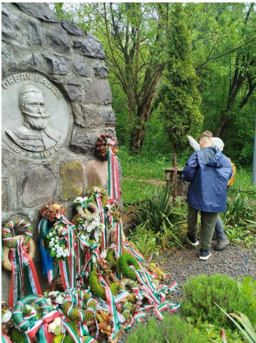
Szelykefürdő, Orbán Balázs emlékműve