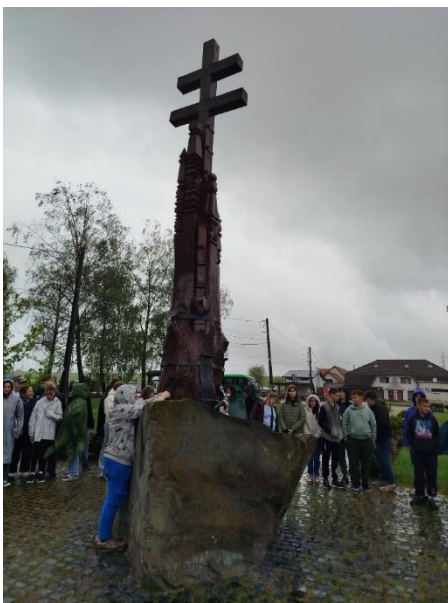
Farkaslaka, Trianoni emlékmű