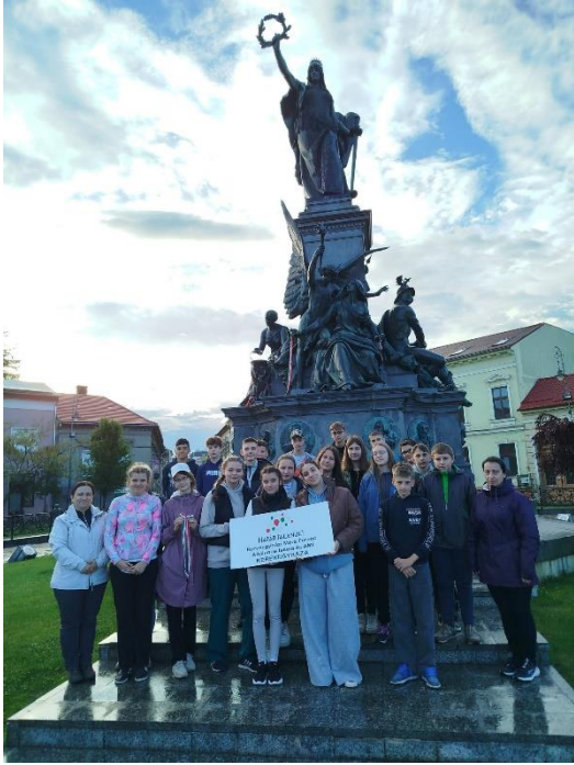
Aradi vértanúk emlékműve