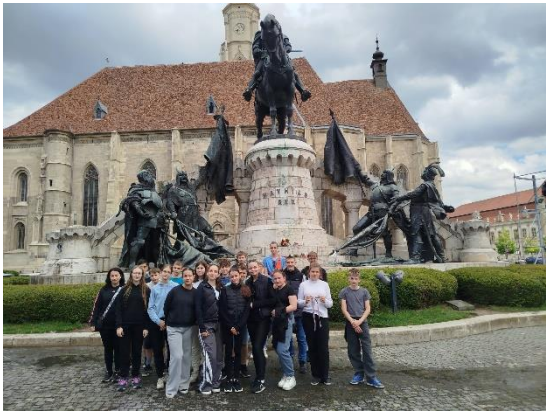
Kolozsvár, Mátyás Király losasszobra