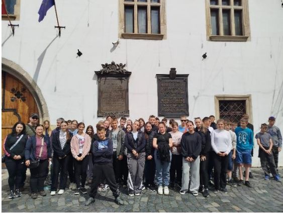
Kolozsvár, Mátyás király szülőháza