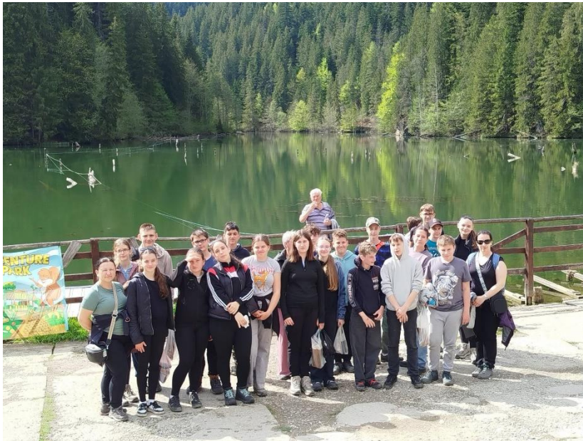
Hargita megye, Gyilkos-tó