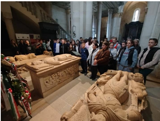
Gyulafehérvár, Szent Mihály-székesegyház