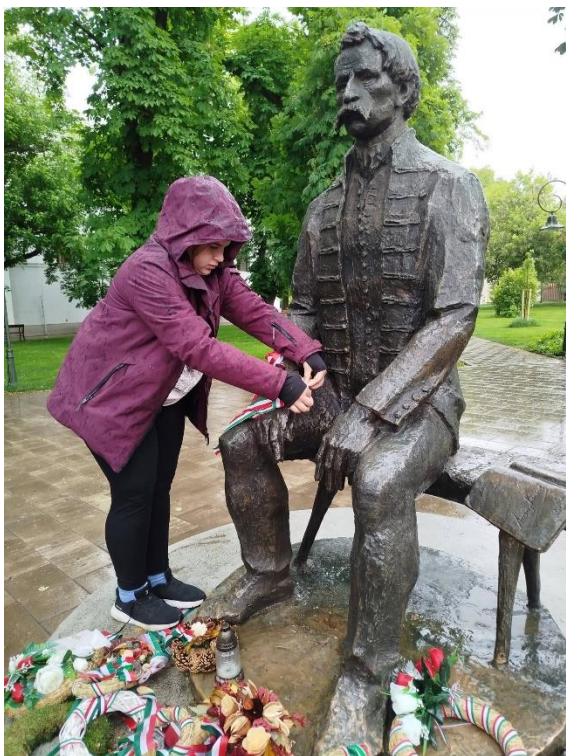
Nagyszalonta, Arany János szobra