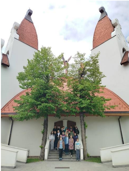
Csíksereda, Millenniumi templom