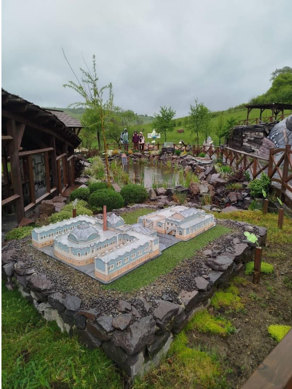
Szelykefürdő, Mini Erdély Park