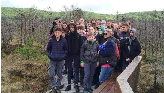
Hargita megye, Mohos tőzegláp